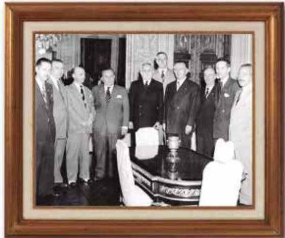
Presidente da República Eurico Gaspar Dutra e Ministro do Trabalho, Morvan Dias, entre diretores da CNTC no ato de assinatura da criação da entidade

A Confederação Nacional dos Trabalhadores no Comércio foi criada em 11 de novembro de 1946 pelo então presidente Eurico Gaspar Dutra. Nos termos publicados no Diário Oficial em 13 de novembro de 1946, “fica reconhecida a Confederação Nacional dos Trabalhadores no Comércio, com sede na Capital da República, como entidade de grau superior, coordenadora dos interesses profissionais dos trabalhadores no comércio em todo o território nacional, na conformidade do regime instituído pela Consolidação das Leis do Trabalho”.